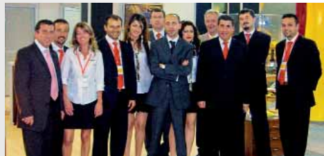
Das Vertriebsteam Haulotte Acarlar bestätigt die Verkaufssteigerung von Haulotte Türkei. Grund um zu lächeln!

Bei der Präsentation ihrer Maschinen Anfang Juni in Istanbul setzte Haulotte Group ihren Fuß auf vertrautes Terrain. Seit 2004 hat sich die Zusammenarbeit mit der Gruppe Acarlar, die die Hubarbeitsbühnen von Haulotte erfolgreich auf dem türkischen Markt vertreibt, intensiviert: 200 Maschinen wurden geliefert und werden in sehr unterschiedlichen Bereichen eingesetzt (Baustellen, lokale Behörden, Flughäfen...) und bei großen Firmen wie Ikea, Toyota, Istanbul Airport, Renault, Turkish Airlines, Carrefour, Bouygues, Mercedes... „Unsere Aussichten für die kommenden Jahre sind sehr ermutigend, bemerkt dazu Serkan Acar, der Generaldirektor von Haulotte Arcalar in der Türkei. Die Bauindustrie befindet sich in vollem Aufschwung und für uns liegt der Schwerpunkt darin, Fachleuten Maschinen hervorragender Qualität anzubieten, um damit die Sicherheit und die Produktivität auf den Baustellen zu erhöhen. Aus diesem Grund haben wir uns für Haulotte entschieden, da diese Firma diesen Kriterien vollauf entspricht und eine Bezugsgröße auf ihrem Markt darstellt.“