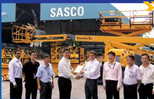
22 Haulotte-Maschinen bei SASCO: eine neue Partnerschaft