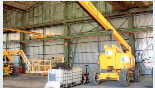
1000 qm zusätzliche Räumlichkeiten in Spanien für den Kundendienst.

> Während das Haulotte Servicecenter seine Tore öffnet, erweitert die Niederlassung HAULOTTE Iberica ihre Räumlichkeiten um 1000 qm, um die steigende Nachfrage nach Verträgen für Wartung und Reparatur in ihrer Werkstatt zu befriedigen. Dieselbe Tendenz zeigt sich für die Region mit der Verstärkung des Netzes von reisenden Technikern, um den stark ansteigenden Servicebedarf im Zusammenhang mit den Verkäufen sicherzustellen: 9 zusätzliche Techniker, um Spanien und Portugal abzudecken und ein Verantwortlicher für die Ersatzteile, um das Netz zu koordinieren und zu beleben.