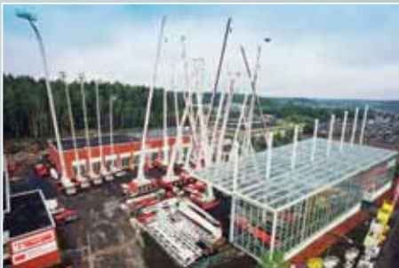
Pekkaniska : erneut 1150 Haulotte-Maschinen auf einen Schlag bestellt!