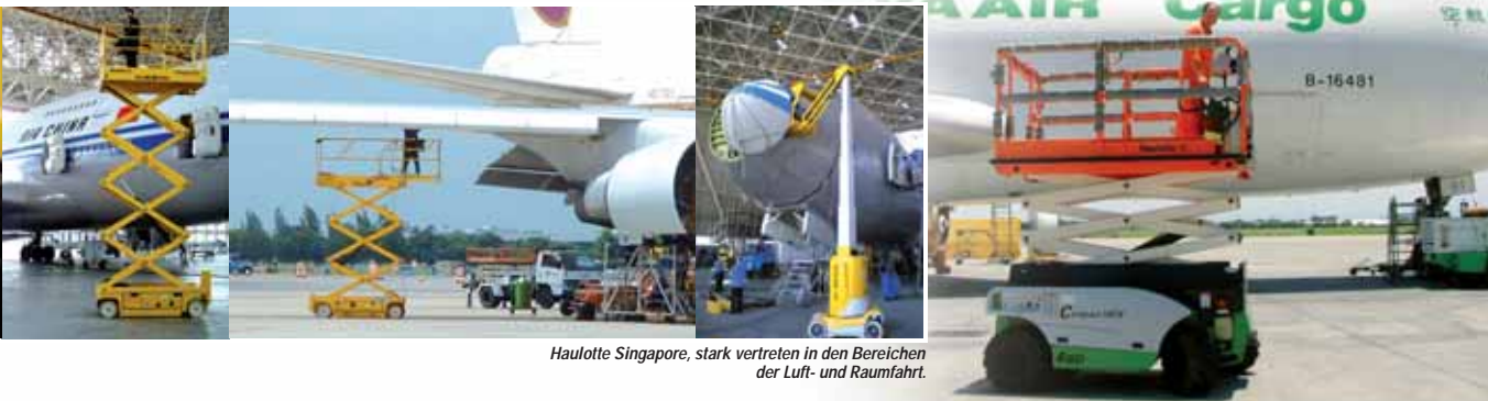
Haulotte Singapore, stark vertreten in den Bereichen der Luft- und Raumfahrt.

Das bedeutet: Noch (fast) alles bleibt zu tun!