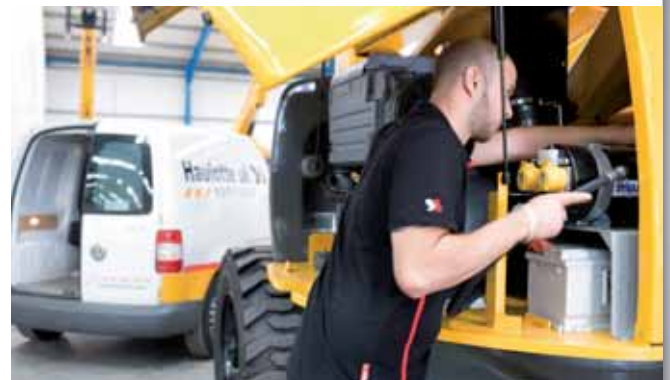
Mit 8.000 am Markt vorhandenen Maschinen in Großbritannien, ist der Kundendienst Priorität für Haulotte UK.

Durch die Teilnahme von Haulotte UK an einer der wichtigsten Fachmessen des Landes, der SED, konnte der französische Hersteller erneut unter Beweis stellen, dass er ein Händchen für anspruchsvolle Ästhetik hat. Der Messestand von Haulotte zeigte sich in elegantem Design und wurde von den Organisatoren mit dem Preis für den schönsten Messestand ausgezeichnet (Foto). Die Haulotte Group beweist ihr Händchen fürs Detail, das zu ihrem Perfektionsanspruch passt.